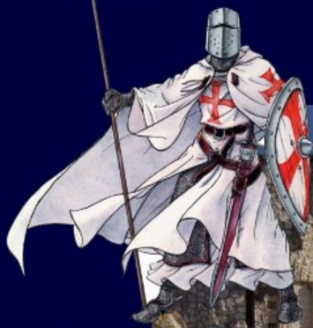
Les templiers Emprisonnés au château